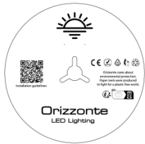
5 Meter pro Rolle