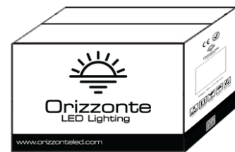
250 Meter pro Karton